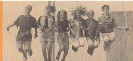
Aus Klug & Fit - Bewegte Schule - Eine Aktion des BM/UK