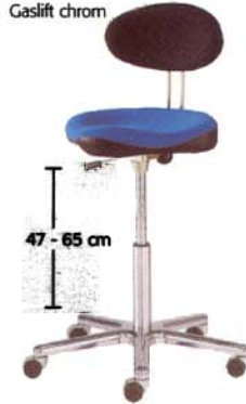
Twister 2 Gaslift chrom