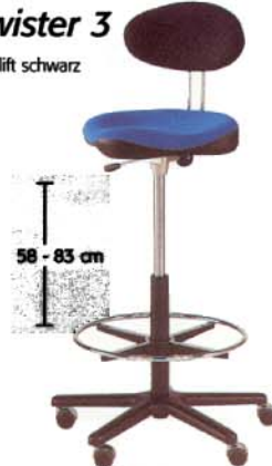
Twister 3 Gaslift schwarz