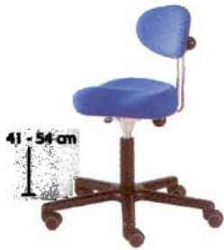
Twister 1 Gaslift schwarz